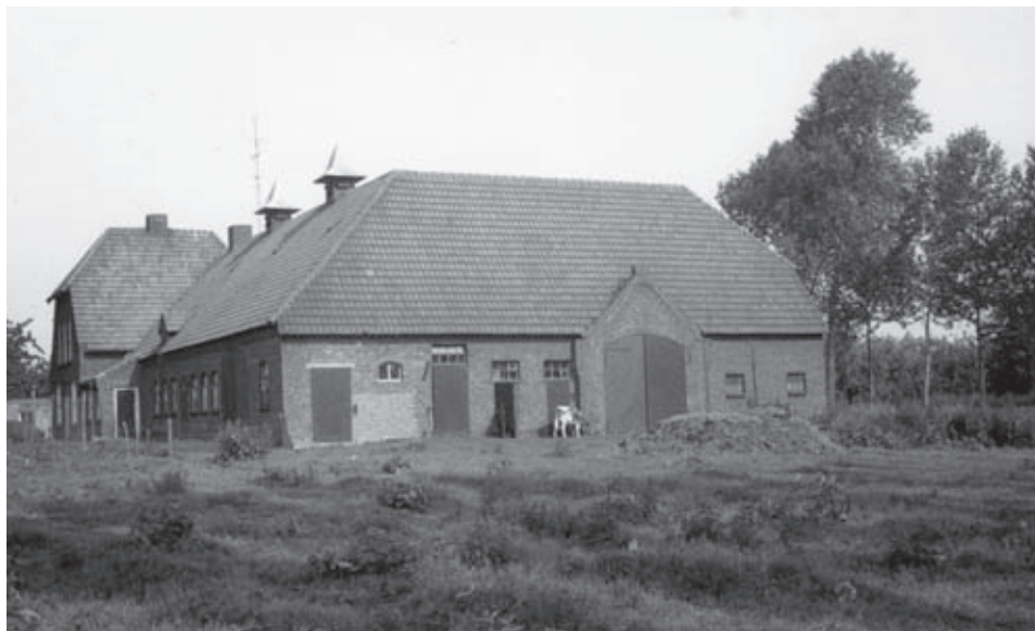
Na de brand in 1938 werd de Kemenade weer opgebouwd. In 1965 werd de boerderij alweer afgebroken.