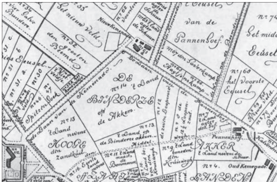
Een deel van de plattegrond van Binderen en omgeving door A. Sassen naar het origineel uit 1758 door P. Ketelaar. Midden boven bevindt zich de Nieuw Kernenade, rechts onder ziet u Oud Kernenade.