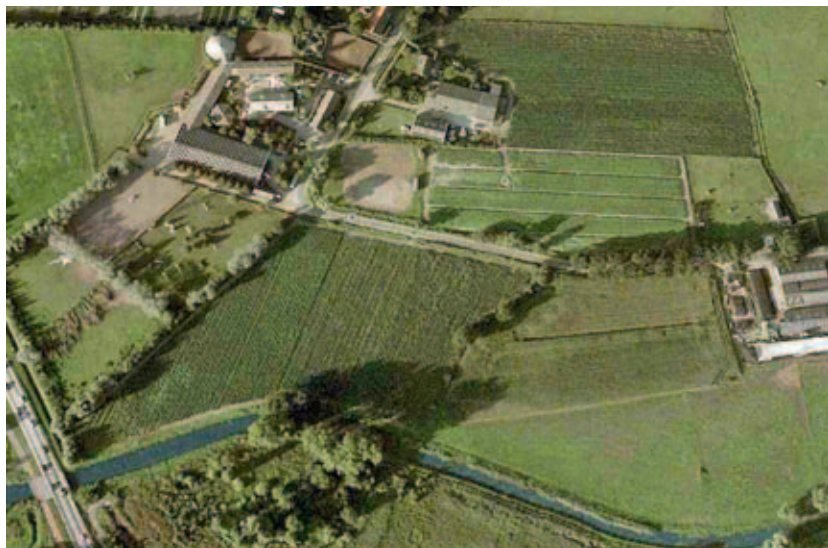
Op deze plek in de Bakelse Aa, ten noordoosten van Helmond, stond eens het 'Watermachien Scepstel'. Scepstal dankt zijn naam aan de familie Van Scepstal, die drie generaties lang eigenaar en gerant van de watermolen was.

De uitvinding van het waterrad was een cruciale stap in de technische ontwikkeling. Hierdoor beschikte de mens over een krachtige mechanische energie. De raderen werden ingezet voor irrigatie in de landbouw en voor het opstuwen van water. Ze zijn lange tijd in velerlei culturen als zodanig gebruikt. Al in de tweede eeuw werd waterkracht aangewend voor de aandrijving van graanmolens. Tandwielen maakten het mogelijk om de beweging van het verticale scheprad over te brengen op de horizontale maalsteen.