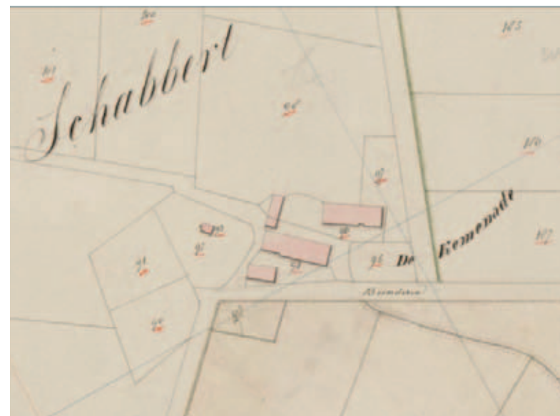
Detail van kasterkaart 1832 sectie B.