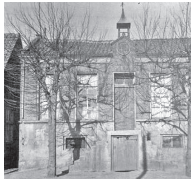
Het kleine raadhuis werd in 1767 gebouwd en in 1931 afgebroken, na nog enige jaren gebruikt te zijn geweest ten behoeve van de Stiphoutse Boerenbond.