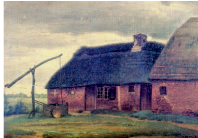
Schilderij in olieverf van een boerderij in Brouwbuis.