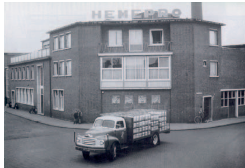
De Helmondse zuivelfabriek Hemepro (ofwel De Eendracht) bevond zich decennialang op het kruispunt van de Beelsstraat en de Hemelrijksstraat.

Boeren brachten er hun melk heen en met behulp van een handkrachtcentrifuge werd daar boter van gemaakt. Deze had een betere kwaliteit en bracht dus meer op dan de boter die voorheen onder primitieve omstandigheden met een karnton of met een hondenkarn op de boerderij werd geproduceerd. Zo legden ze de basis voor de huidige welvaart op het platteland in deze streken. Helmond volgde in deze ontwikkeling zijn eigen weg. In zijn lezing schetste Bierkens aan de hand van historische beelden de ontwikkeling van boterfabrieken tot wereldconcern FrieslandCampina, met daarbij speciale aandacht voor de bedrijvigheid in Helmond en de Peel.