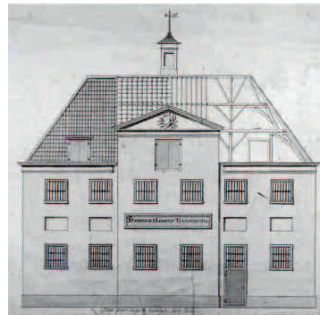
Gevel aan het Oude Vest van het tuchthuis 'Het Spinhuis' in Breda, anno 1775. (Tekening A. Canters Breda's Museum)