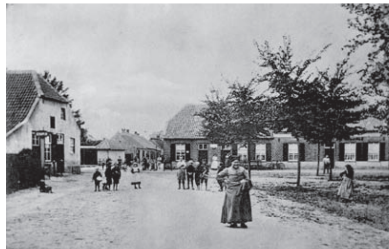
De Lindenberg in Stiphout rond 1900.